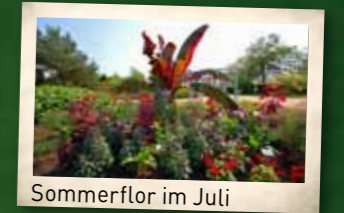
Sommerflor im Juli