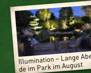
Illumination – Lange Abende im Park im August