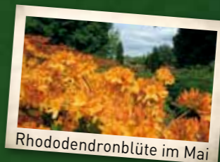
Rhododendronblüte im Mai