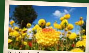
Dahlie im September