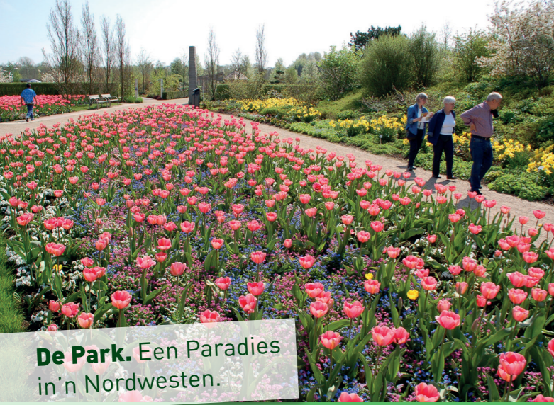
De Park. Een Paradies in'n Nordwesten.

Dat gifft Stäen, de röögt een so an, de mööt man tominnst eenmal in't Leven sehen hebben. So as de Park der Gärten - Düütschlands gröttste Mustergartenanlaag.