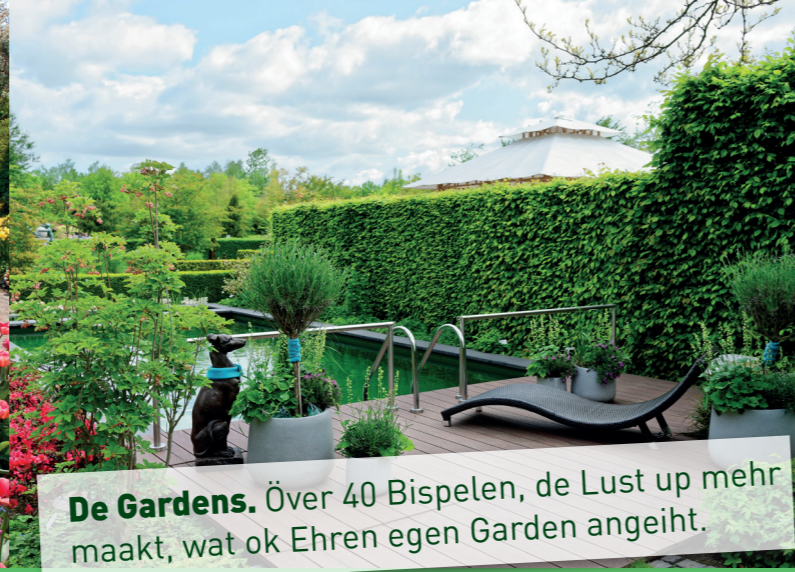
De Gardens. Över 40 Bispelen, de Lust up mehr maakt, wat ok Ehren egen Garden angeiht.

Speelplatzen, Eten un Drinken un Events sind ok dorbi - dat is Gardenlust pur!