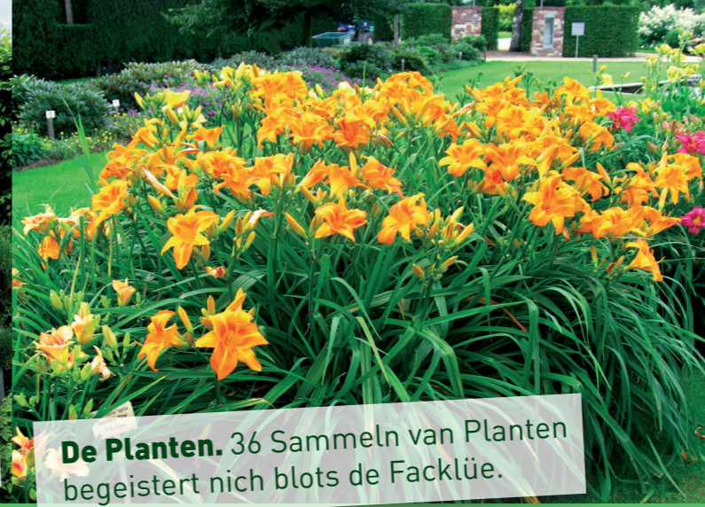
De Planten. 36 Sammeln van Planten begeistert nich blots de Facklüe.