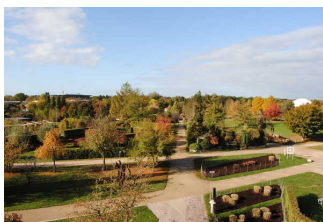
Park der Gärten