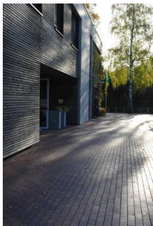
Weg vom Parkplatz für Menschen mit Behinderung zum Eingang