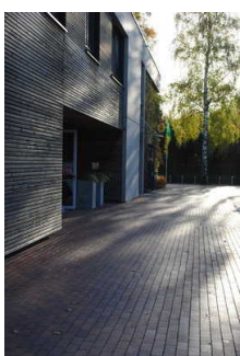
Weg von der Bushaltestelle zum Eingang